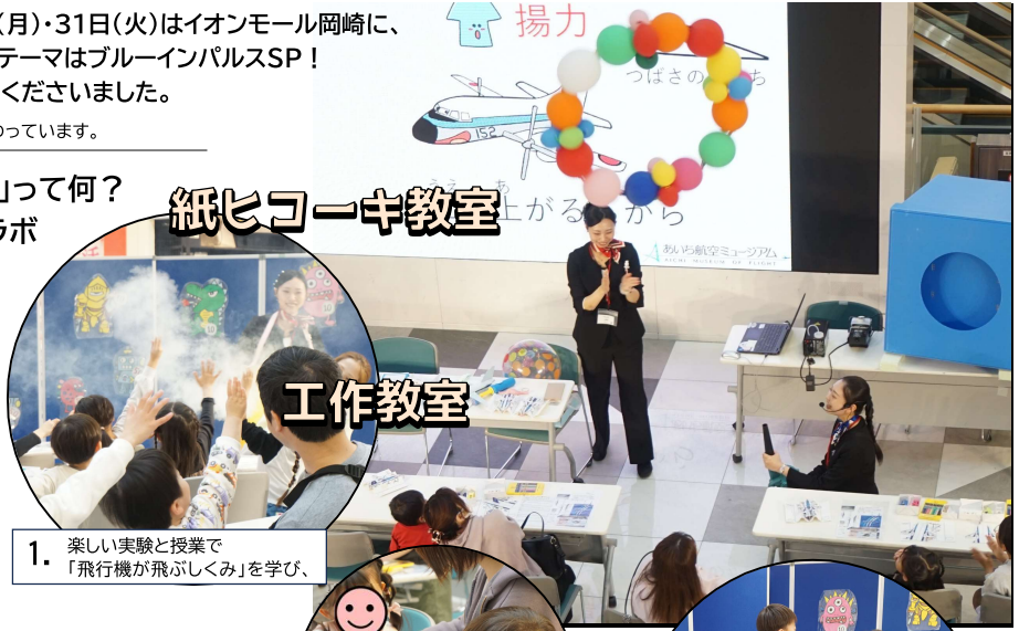
1. 楽しい実験と授業で「飛行機が飛びたくみ」を学び、

こうしたイベントで嬉しいのは、ご家族の発見の場に立ち会えることです。「うちの子まだ小さいけど大丈夫かな」と心配されていたお母さまが、授業を一生懸命に聴くお子さまの表情を見て驚いていたり、大人っぽい制服を着たお子さまが鏡の前でちょっと恥ずかしそうにしながらも嬉しそうにポーズをとっていたり、そんな素敵な瞬間がたくさんありました。なんと尊い…! おかげで私たちも笑顔全開、表情筋まで筋肉痛になりました(笑)。こうした体験が、航空機への興味や航空業界への憧れ、休日の楽しい思い出などにつながらいいなと願い、運営を続けています。