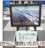
航空自衛隊 松島基地からご提供いただいたブルーインパルスのパネルやサインも展示!

あいち航空ミュージアムの出張をご希望の企業様・団体様は、サンデーフォークマネージメント(下記)までお気軽にお問い合わせください!