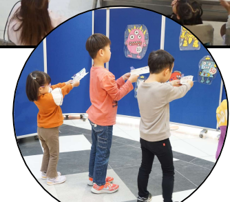
3. 特製パネルに向かってみんなで飛行機を飛ばして遊びます。