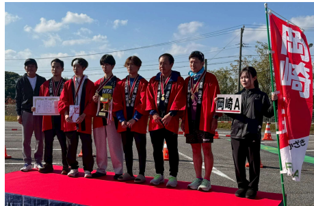
優勝は岡崎Aチーム。2位との接戦がドラマチックでした！

1周が約1.7kmのため、ある程度ランナーがバラついて走り過ぎてくれるのですが、なるほど、やってみると毎年計測に苦心する理由がわかってきました。理由1)第1走者は2周、第2走者は1周、第3走者は3周、と走る周数が異なる、理由2)レースが進むほどに○チームは第5走者までタスキが渡ったけれど△チームは第3走者というように差が広がっていく、理由3)1周ずつで交代する違う駅伝レースの走者と混ざる、理由4)そんな状況下で1人あたり約10チームの計測を担当する——。そんな中、「ねえさん、このチームもう通り過ぎましたよ」「いやいや、惑わさないで！」など互いに足をひっぱり合いながら(?)、ランナーを見失うことなく約3時間の計測をやりきりました。全チーム最後まで走り抜いた姿はすてきて、爽快な1日でした！